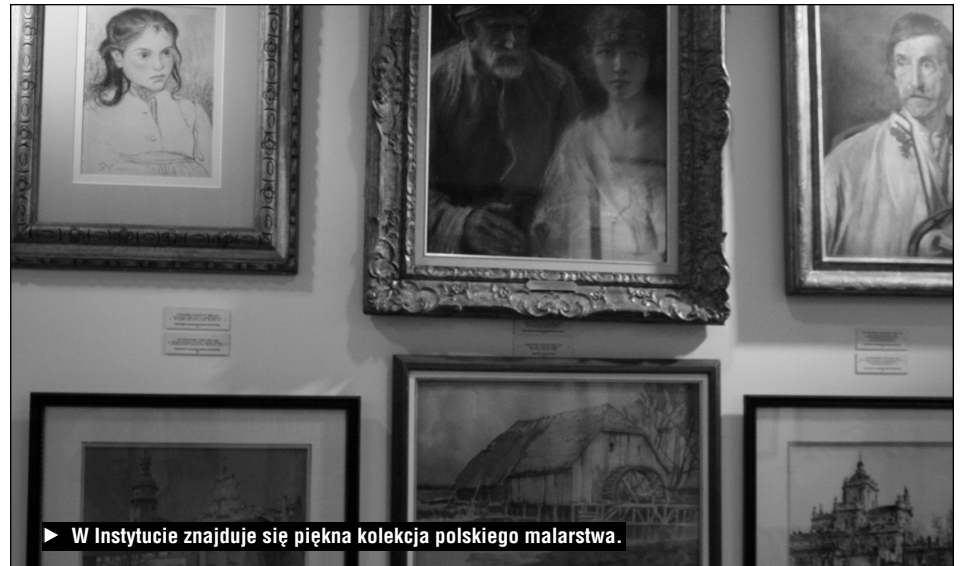
▶ W Instytucie znajduje się piękna kolekcja polskiego malarstwa.