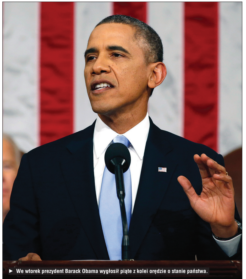
► We wtorek prezydent Barack Obama wygłosił piąte z kolei orędzie o stanie państwa.