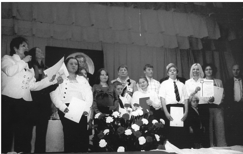
Ogłoszenie wyników konkursu pt. Jan Paweł II w oczach dziecka, zorganizowanego przez Centralę Polskich Szkół Doksztalających. 2 kwietnia 2006. Instytut Piłsudskiego był sponsorem tego konkursu dzięki grantowi Senatu RP.