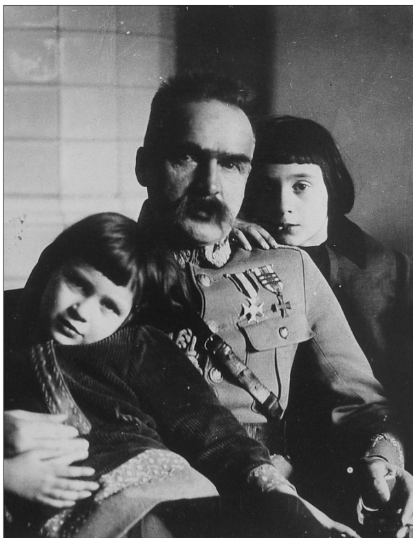
Józef Piłsudski z córkami Wandą i Jadwigą w Sulejówku.

Następnie zacząłem układać fotografie zgodnie z nowym układem tematycznym. Z powodu zbyt dużej ilości fotografii w stosunku do półrocznego czasu stażu (kolekcja liczy ponad 20 tys. fotografii) udało się nadać nowy układ dla pkt. 1-5, przy czym pkt 5, czyli II wojna światowa nie został ukończony. Kolejnym punktem pracy było przepakowanie już poukładanych fotografii w nowe koperty i pudełka, które zakupiono ze szczególnym uwzględnieniem parametrów bezkwasowości, które konsultowałem z Centralnym Laboratorium Konserwacji Archiwaliów. Wreszcie przystąpiłem do nadawania sygnatur oraz wykonania pomocy ewidencyjnych w postaci inwentarza i bazy danych w programie