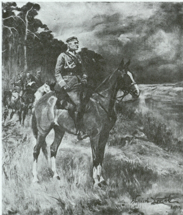
MARZAŁEK JÓZEF PIŁSUDSKI NA KASZTANCE pędzla Wojciecha Kossaka, 1929 r. (w zbiorach Instytutu).