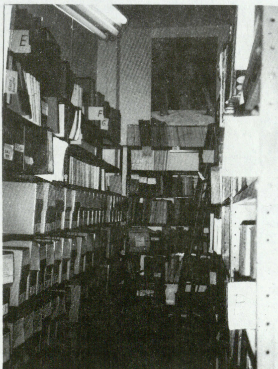
Dział Periodyków i Prasy Instytutu.