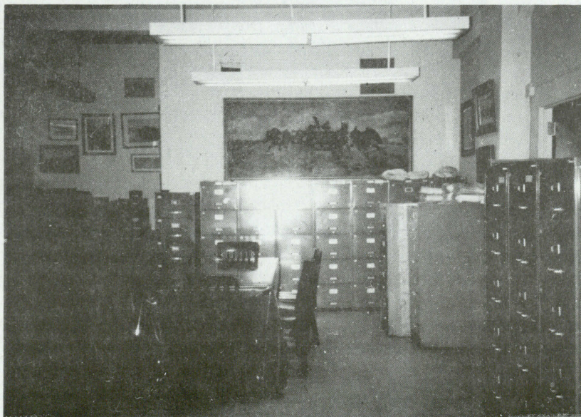
Fragment Archiwum i Sali Zebrań Instytutu.