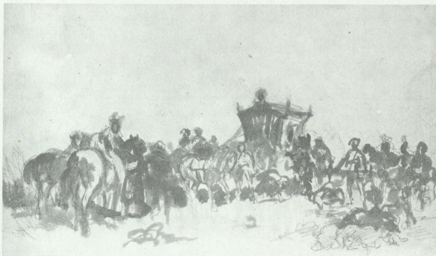
Jan Matejko - "Karoca z konnymi"