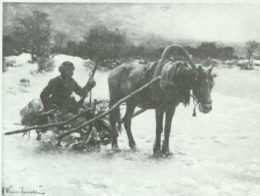
Alfred Wierusz-Kowalski - "Myśliwy na saniach"